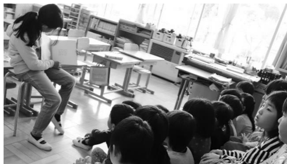
1年生の教室で6年生が絵本の読み聞かせ

23日(火)から、平日の部活動が再開されます。夏の大会がキッズデイズの10月になり、部活動の見直しも進んでいます。半面、部活動の意義や価値もあります。可能な範囲で目標を定め、チームメイトとともに汗を流し、心と体を鍛え、友情を育んでほしいと思います。