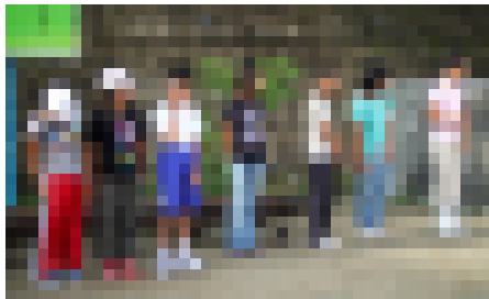
宮小が朝の会を担当