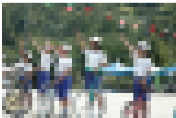
大成功だった一輪車パレード