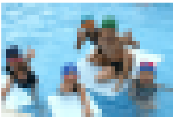
お気に入りの宮小特製ボートの上で

んにおいつくことです。プールで、かおつけができるようになったのは、こころがおうえんしたからです。みんなにおいつけるように、がんばりたいです。