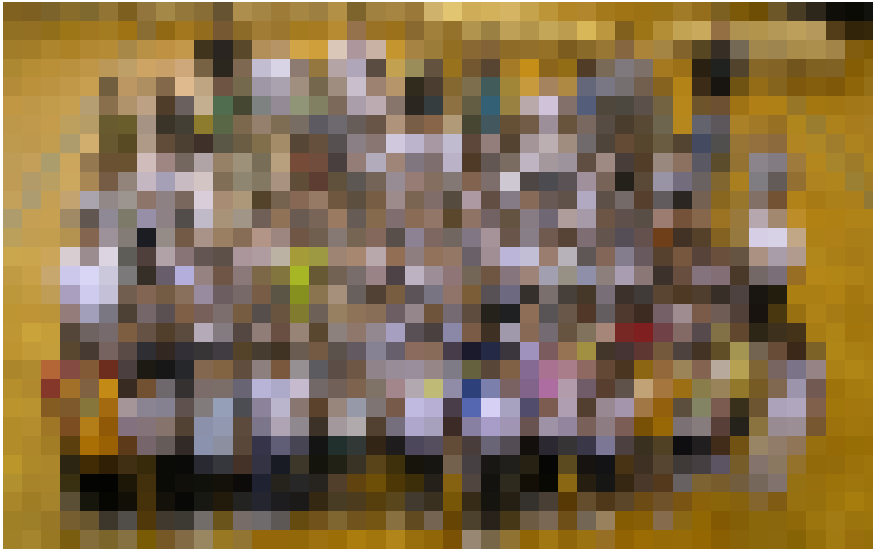
額田地区小学校五年生全員で記念撮影