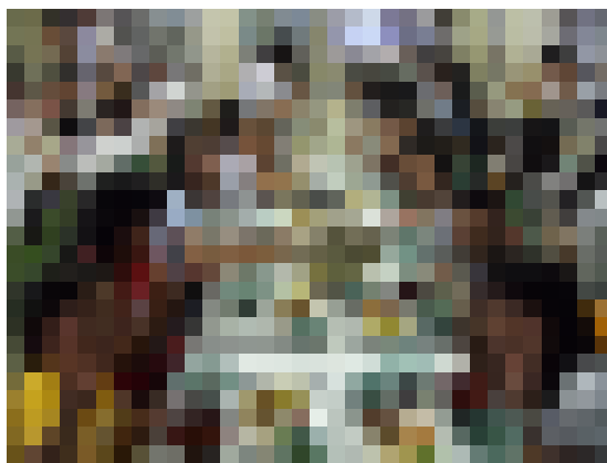
他校の子と一緒に

るか少し心配でした。 十時に学校を出て、岡崎市少年自然の家へ向かいました。いろいろな学校のみんがバスに乗って十時四十分ごろに着きました。荷物置いて少し時間がありました。荷物の自己紹介をしました。その時みんなは、少しきんちようして、声が小さかったので、私は、だいたいよぶかなと思いましたが、昼食の時も会話がなくて少し困りました。その後、自分たちの部屋に行くとトランプで遊びました。その時に、みんなと仲良くなることができました。みんなで楽しく遊ぶこ