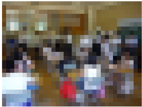
へき地複式教育研究協議会での3・4年生の授業

だれよりも、漢字をおぼえるぞ、と思いつながらやっています。そう思いながらやると、自分でも、ゼったいに漢字をおぼえるぞ、という気持ちができるからです。