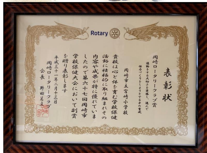
↳ 岡崎ロータリークラブより