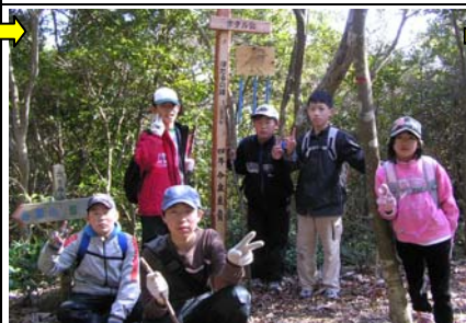
14:15 ホタル山(14/24)着。ヤマガラ絵を描いたホタルの鐘。