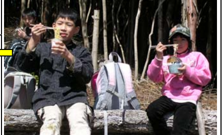
12:43 幻の岩清水着。清水を汲んでお湯を沸かし、カップラーメンを食べる。海を見ながら食べるラーメンの味は最高。ゆっくりと昼食タイムをとり 13:33 出発。