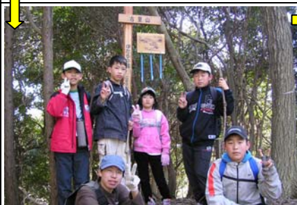
14:10 ふるさと山(13/24)着。スズメの絵を描いたホタルの鐘。