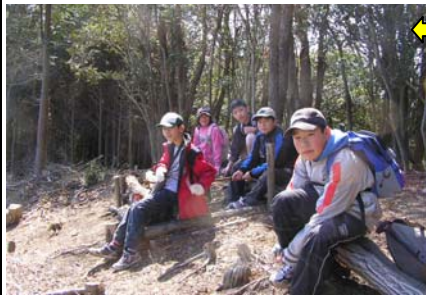
13:49 見晴らし場着。ここからも三河湾がきれいに見えた。