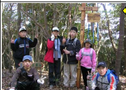
14:07 ササユリ山(12/24)着。トビの絵を描いたホタルの鐘。