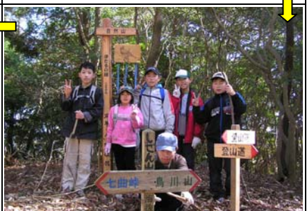
14:02 自然山(10/24)着。オオルリの絵を描いたホタルの鐘。