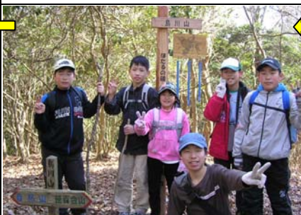
14:05 鳥川山(11/24)着。ムクドリの絵を描いたホタルの鐘。