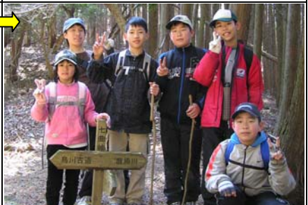
14:00 七曲峠着。ここから後半戦。さあ、がんばるぞ。