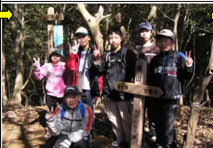
13:57 南山(9/24)着。南山大との交流の記念に名づけた山。