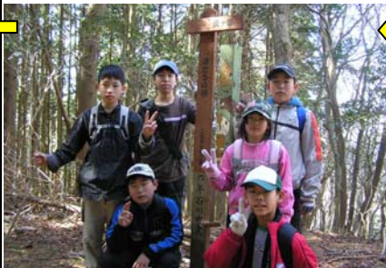
13:42 京ヶ峰(8/24)着。視界はないがのびやかな山頂。