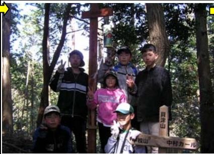
12:28 貝津山(7/24)着。ここから再び愛宕山方面へ引き返す。