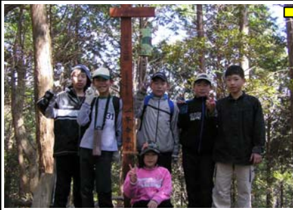
12:25 学校山(6/24)着。視界はない。鳥川小の裏山にあたる山。