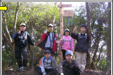
14:26 豊山(15/24)着。オオルリの絵を描いたホタルの鐘。