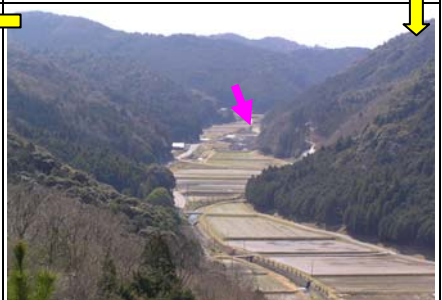
11:24 見晴ヶ丘着。正面に鳥川小学校がよく見えた。