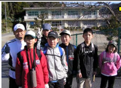
8:15 学校出発。この先の苦勞も知らず気樂なスタート!

2009年3月15日(日)、今年度の卒業記念イベントとして「ホテルの里の山歩きコース」で紹介されている全24山を一日で制覇することに挑戦しました。参加者は、鳥川小3年生1名、5年生1名、6年生3名、卒業生1名、教員1名の合計7名。朝8:15に鳥川小学校を出発し、ちょうど8時間後の16:15にすべての頂上を制覇して鳥川小学校に戻ることができました。ここにその全記録を紹介させていただきます。