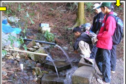
9:37 延命水着。大雨の後で、いつもより水量が多かった。