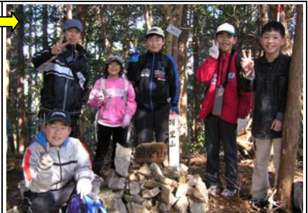
9:07 額堂山(1/24)着。登頂記念にモミジの苗木を植えた。