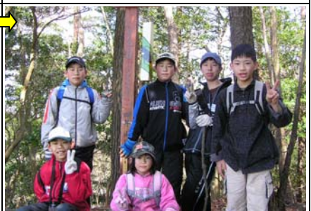
10:59 遊山(4/24)着。ここからも三河湾がきれいに見えた。