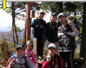
10:39 水晶山(3/24)着。田原の蔵王山もよく見えた!