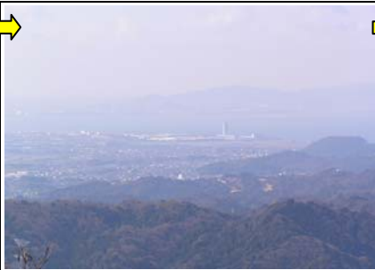
8:57 額堂山の見晴らし場到着。三河湾がきれいに見えた。