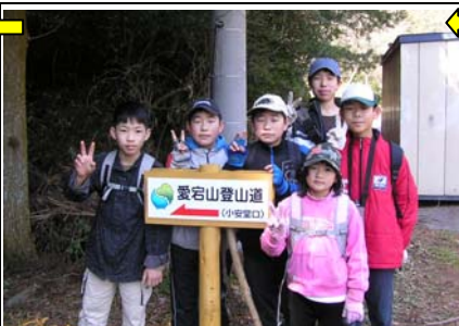
11:42 小安堂口着。ここから再び登山道に入り愛宕山をめざした。