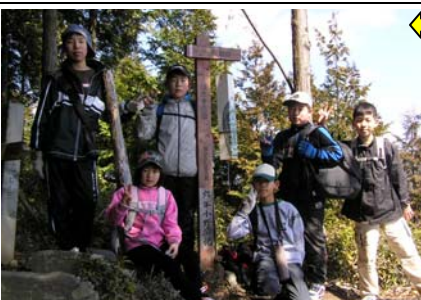
12:14 愛宕山(5/24)着。ここからの三河湾の眺めも絶景!