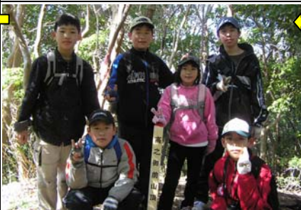
10:30 高野御前山(2/24)着。ここにもモミジの苗木を植えた。