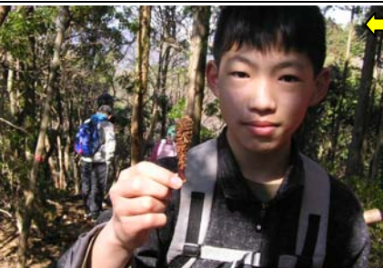
水晶山に向かう途中、エビフライ(リスの食痕)を発見。